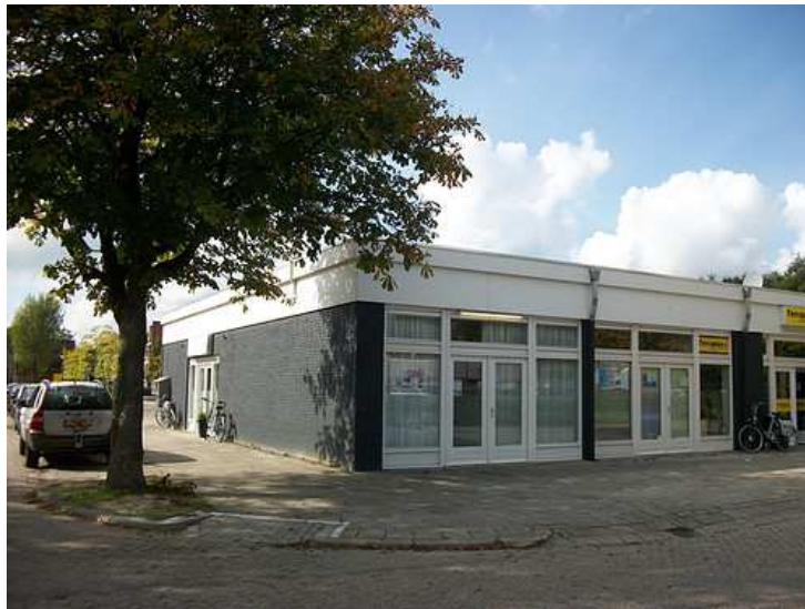
Het Ontmoetingscentrum 'Jonge Ouders'