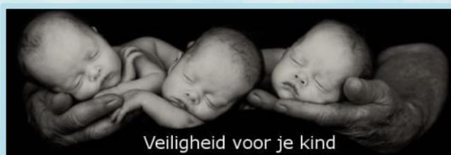
Veiligheid voor je kind

Iedere donderdag van half 10 tot 12 zijn jullie welkom bij de 23+ groep. A.S. donderdag komt er iemand van de GGD langs om iets te vertellen over kind en veiligheid. We hopen jullie allemaal gauw te zien.